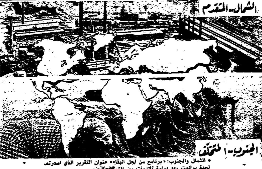
الشرق - القدام

هذا الشبح الذي أسمه الخوف، يقلم : واجد دوماني. ولد الانسان في مه وتلقاه في خوف، والخوف ظاهرة انسانية، ولكنها في كثير من الأحيان تتحول إلى رهبة مدمرة.